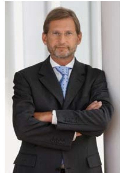
Dr. Johannes Hahn Bundesminister für Wissenschaft und Forschung

Mit dem Statistischen Taschenbuch 2009 und dem Datawarehouse Hochschulbereich steht allen, die an Hochschul- und Forschungsfragen interessiert sind, wieder eine reichhaltige Informationsquelle mit validen Daten und Fakten, übersichtlichen Statistiken und ausgewählten Kennzahlen zur Verfügung.